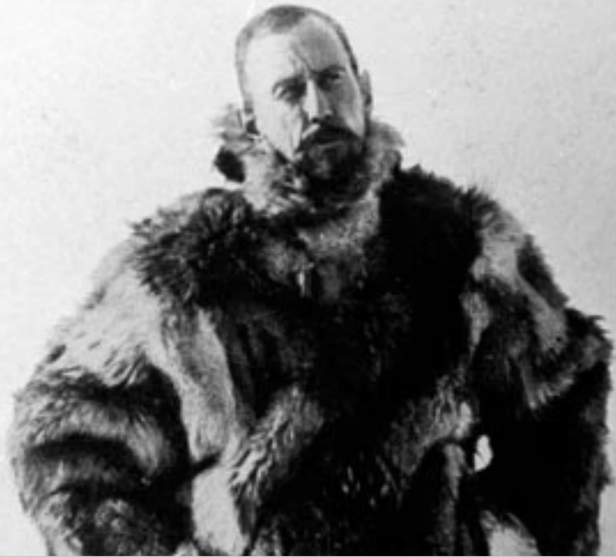
Roald Admunsen a conquis le pôle Sud en 1911 pour la Norvège