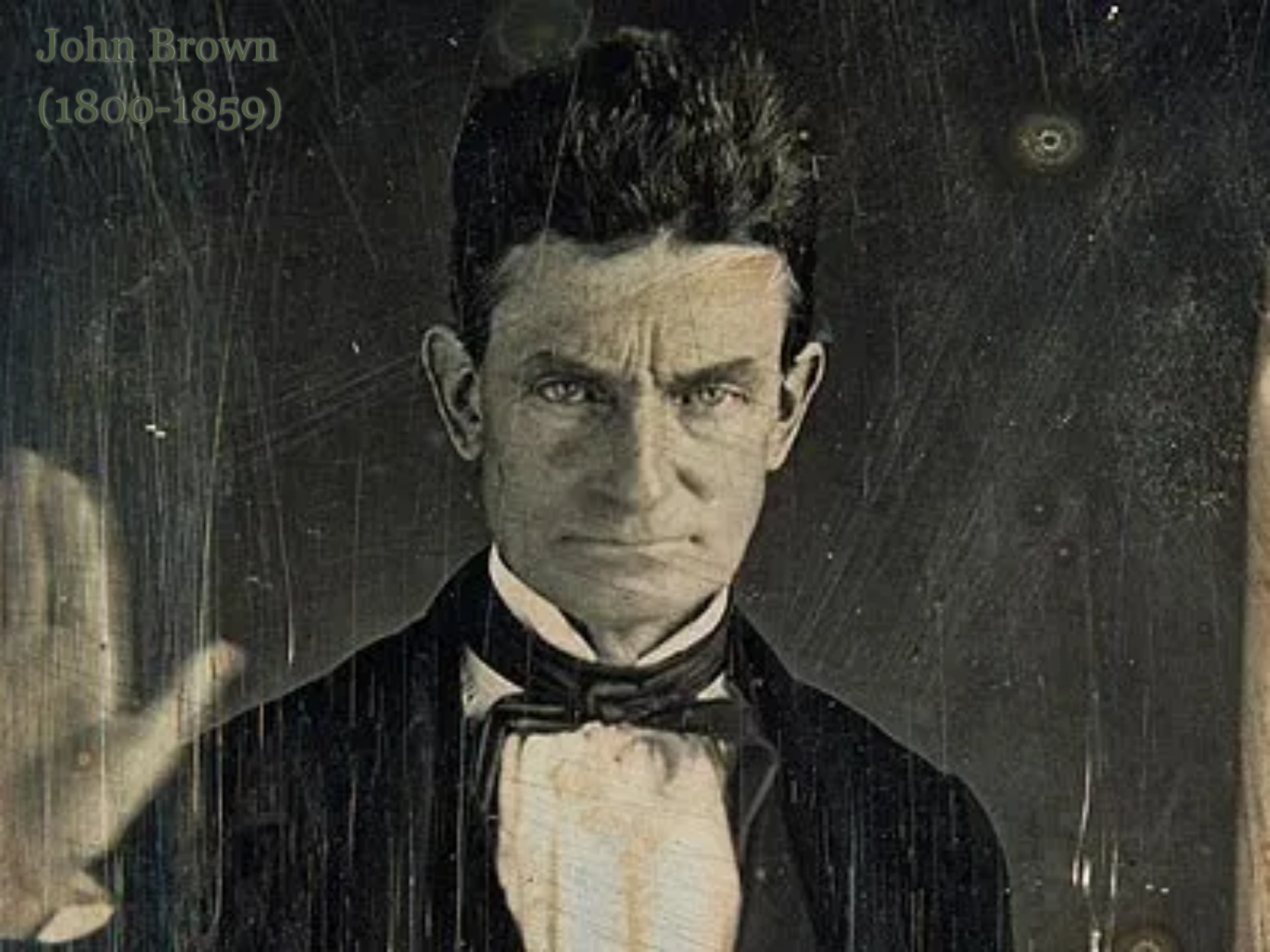
John Brown (1800-1859)