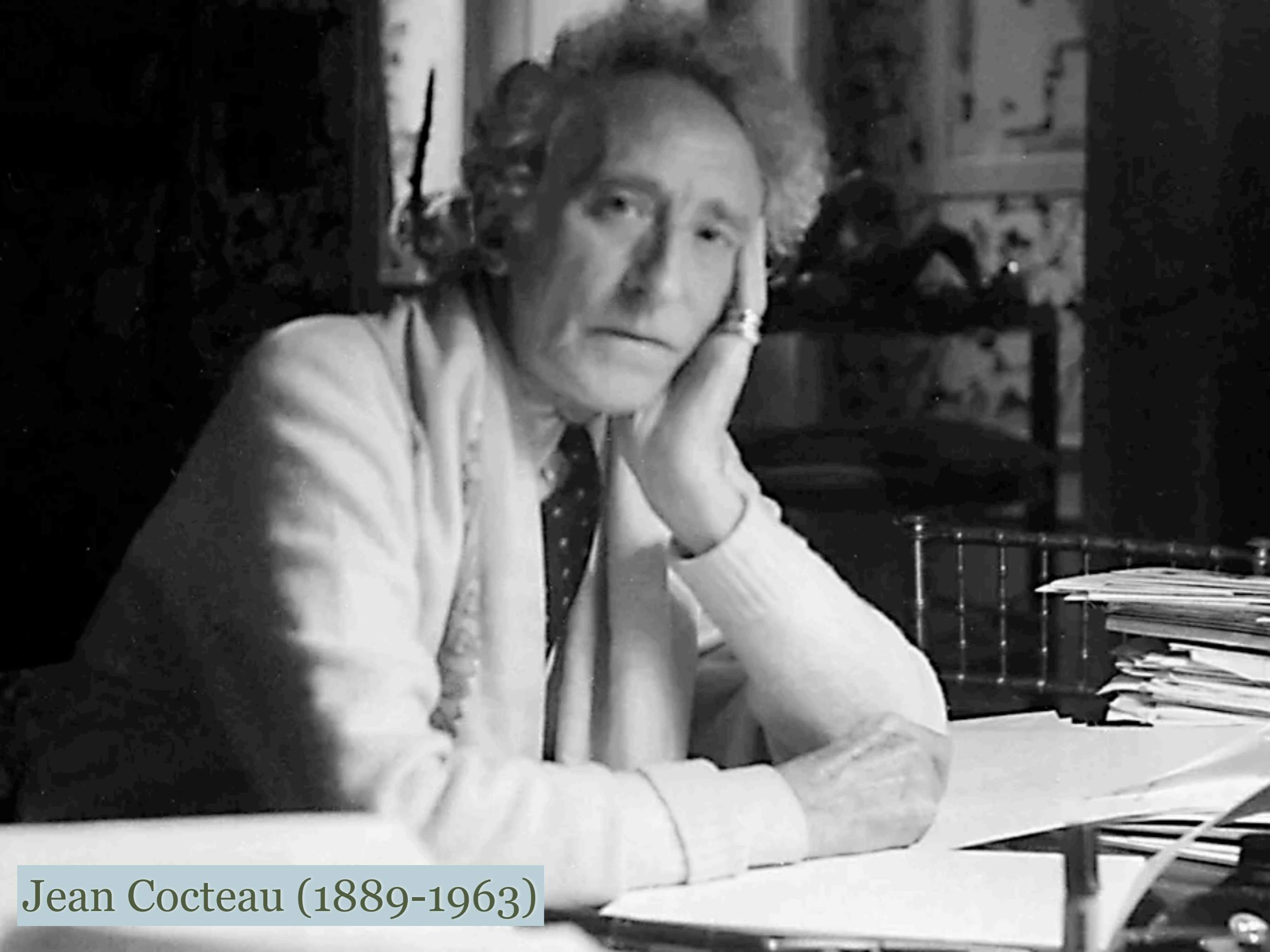
Jean Cocteau (1889-1963)