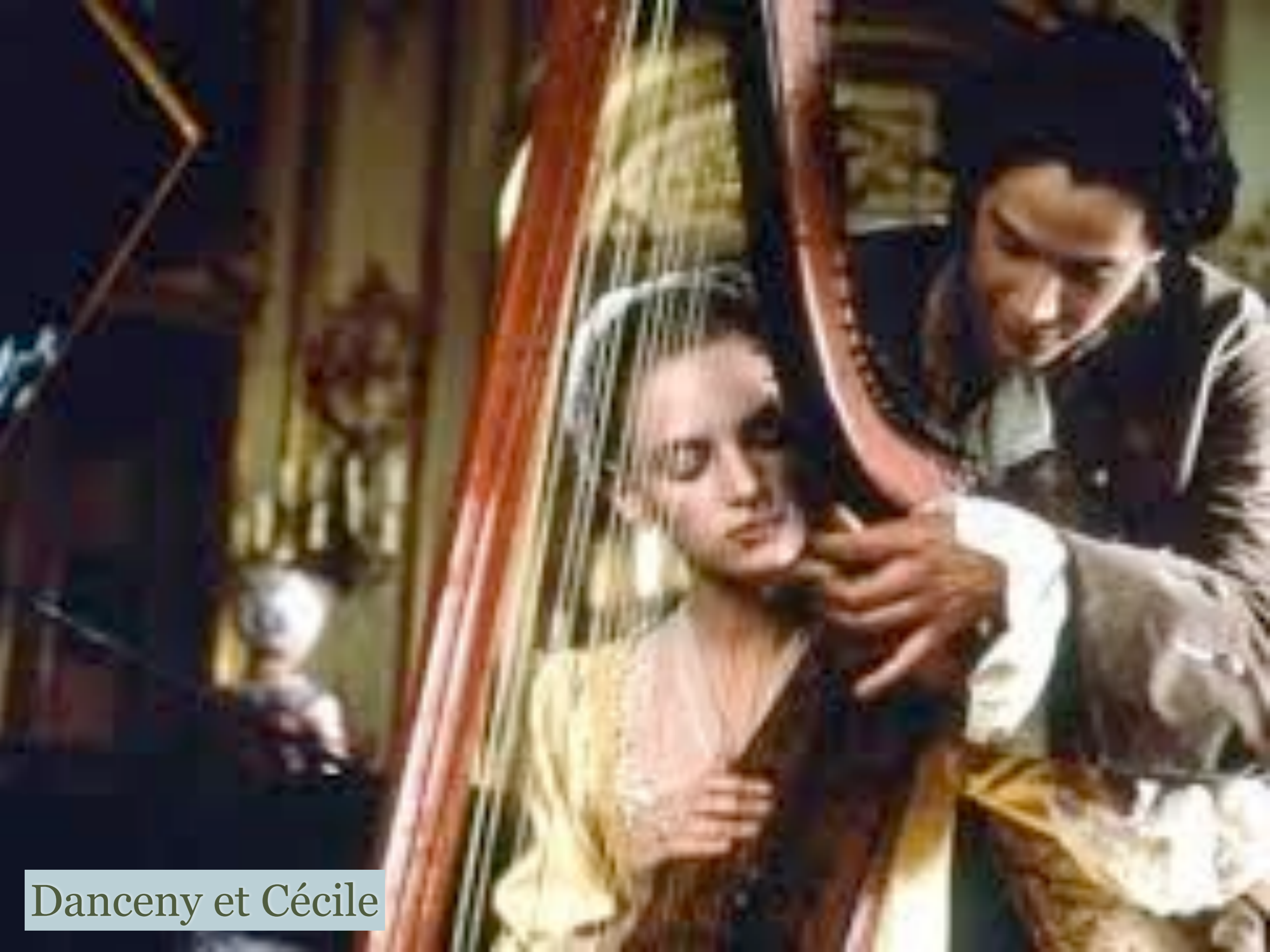
Danceny et Cécile