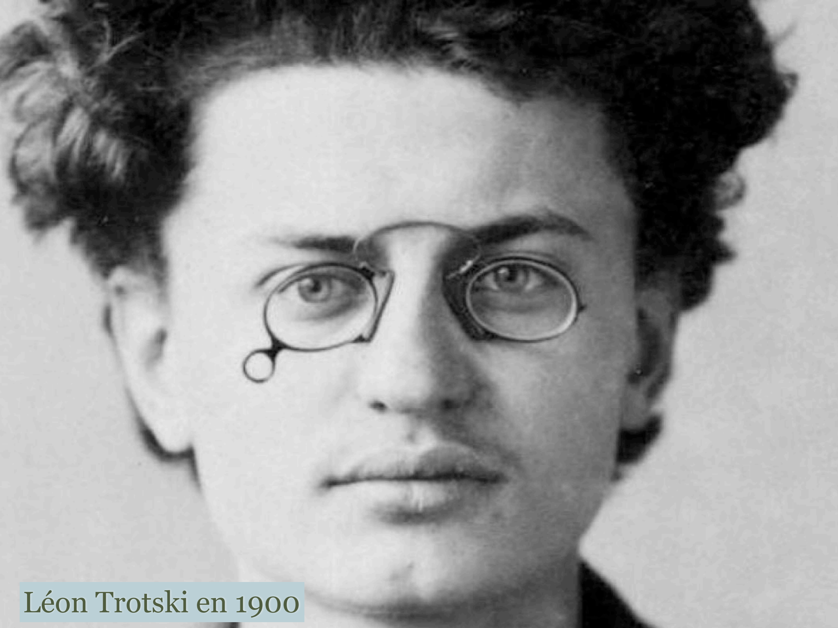
Léon Trotski en 1900