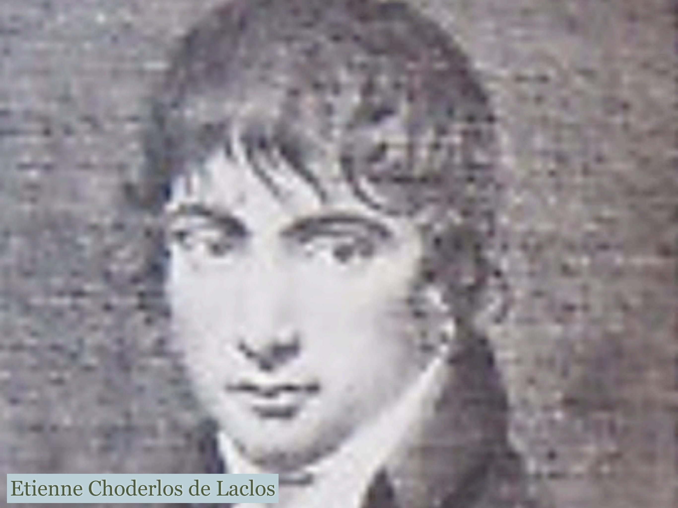
Etienne Choderlos de Laclos