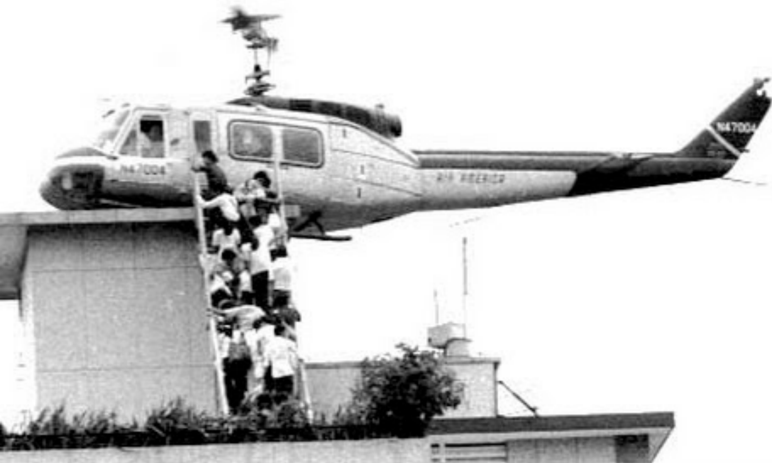
1975 : le dernier hélicoptère évacue l'ambassade des USA à Saïgon