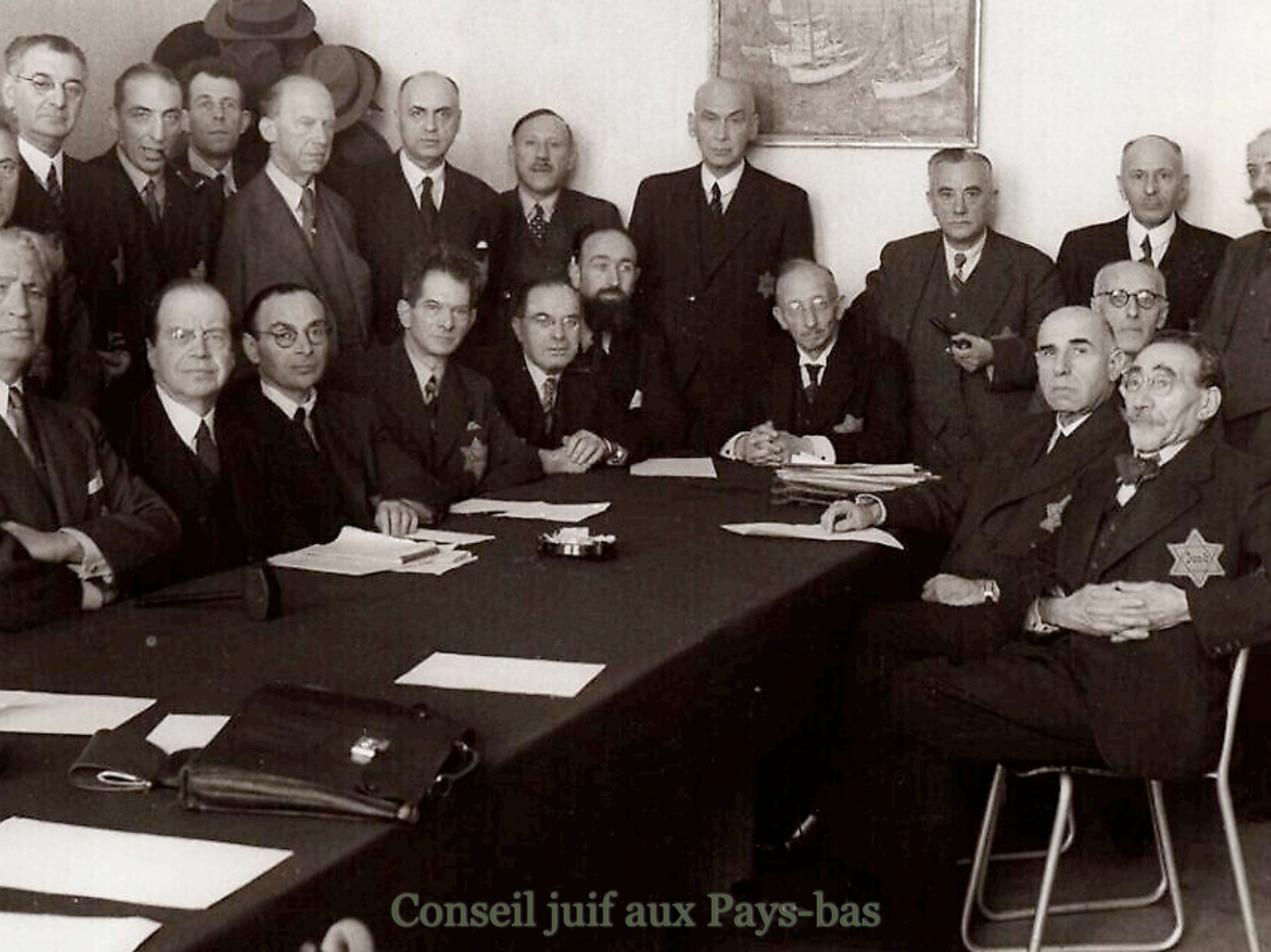
Conseil juif aux Pays-bas