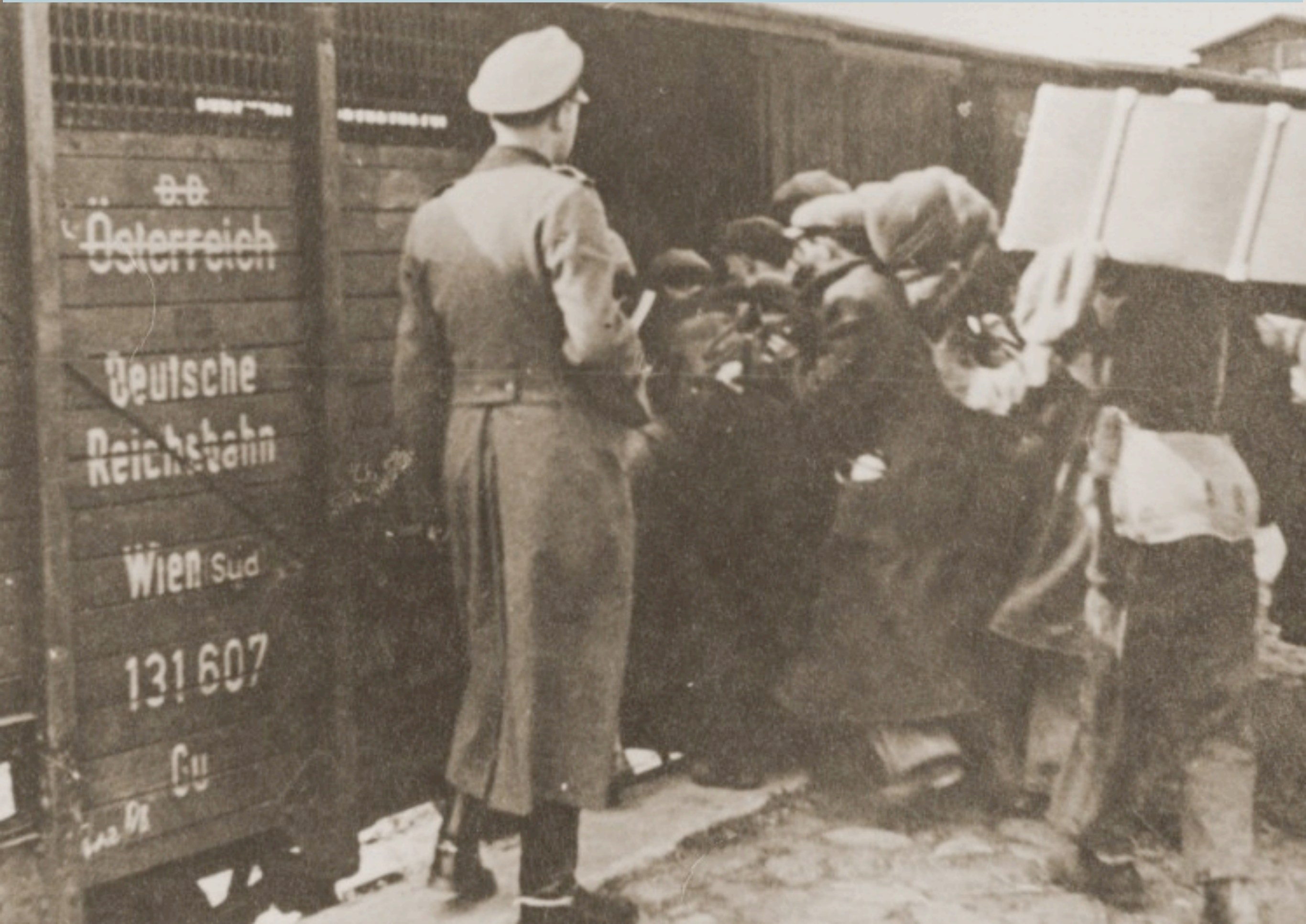
départ de Lublin pour Belzec, camp d'extermination en Pologne