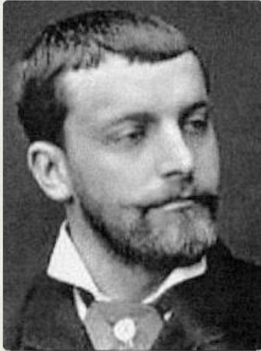
Alfred de Musset