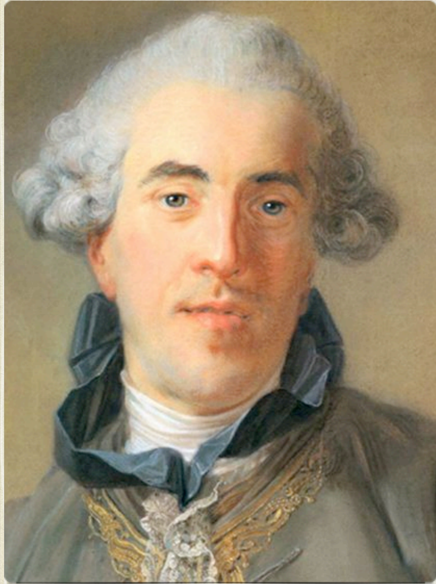
Pierre Choderlos de Laclos