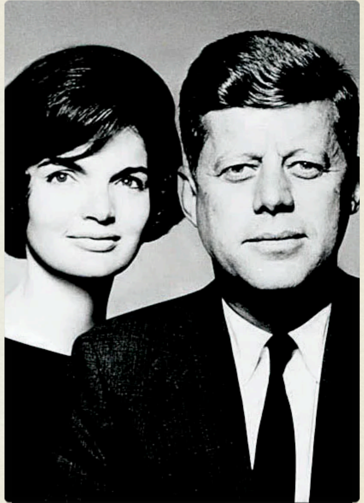
John Fitzgerald Kennedy